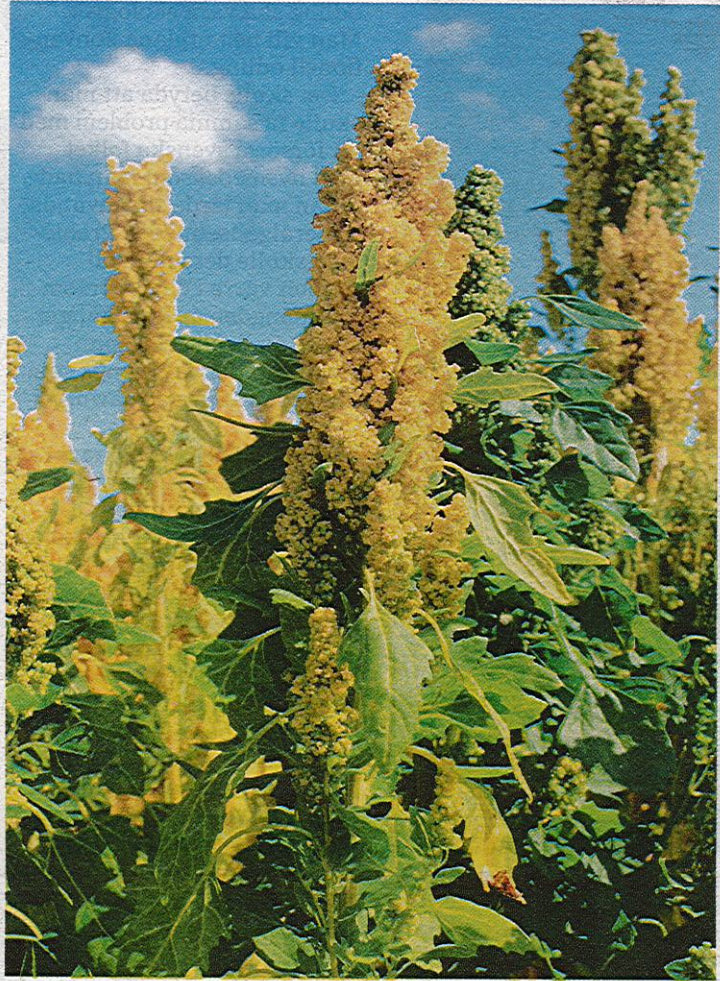
GULDFRÖN. Quinoan är släkt med våra svinmållor.

Det gör ogräsbekämpningen arbetsintensiv. Fälten körs två gånger med hacka så att gångarna mellan raderna blir ogräsfria. Sedan får man hacka för hand mellan plantorna.